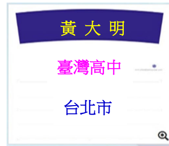
例 4.因借用同學校他人衣服， 致姓名錯誤及高中皆需貼遮