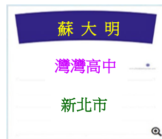
例 6.因借用不同縣市選手的衣服， 致姓名、高中、縣市皆錯， 已違反技術手冊中需有單位 名稱之規範。