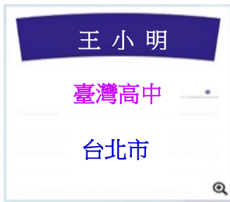
例 3.尚符合本會背布標準規範 但籌備會規定需將校名貼遮