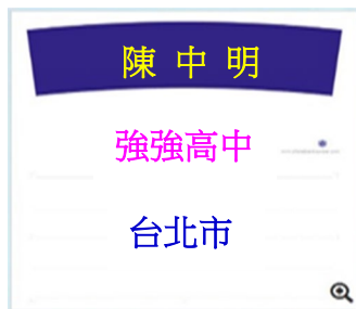
例 5.因借用不同校名但同縣市選 手的衣服，致姓名、校名皆錯誤 皆需貼遮