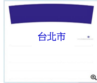
例 2.尚符合本會背布標準規範