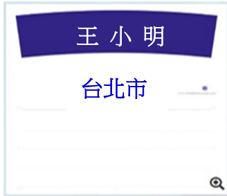
例 1.符合本會單位背布標準規範